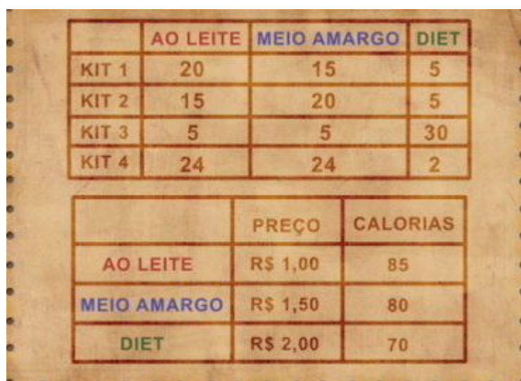
Figura 1: Tabelas com as informações